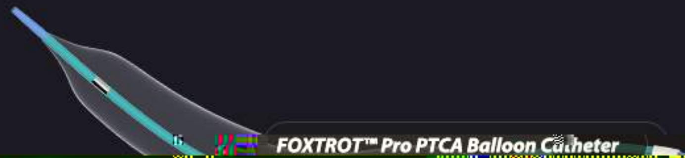
FOXTROT™ Pro PTCA Balloon Catheter